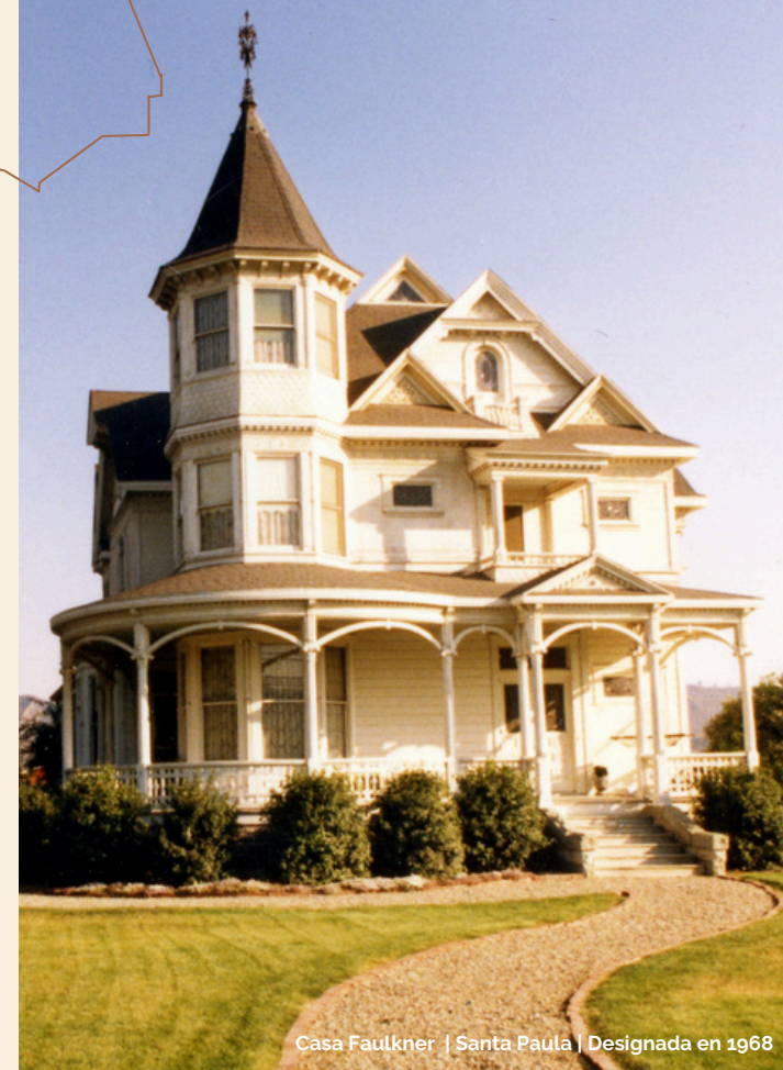
Casa Faulkner | Santa Paula | Designada en 1968