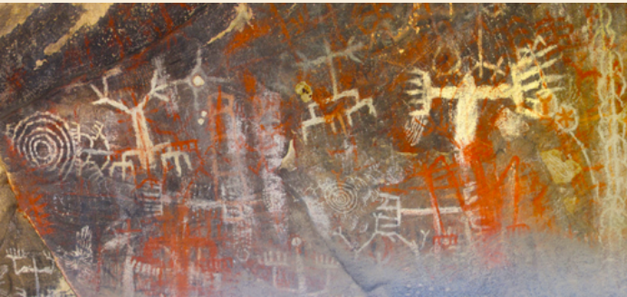
Cueva pintada de Burro Flats | Simi Hills

Para obtener más información sobre la historia indígena en el condado de Ventura, visite vlandmarks.org .