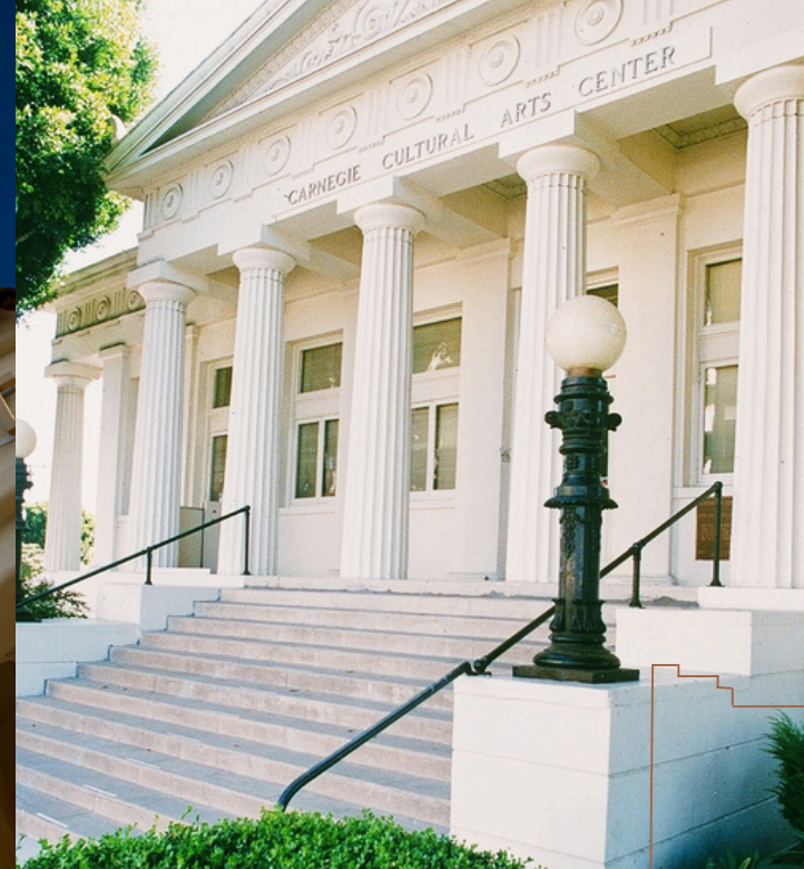
Biblioteca Oxnard Carnegie | Oxnard | Designada en 1971